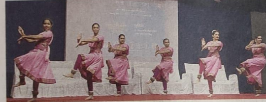
'कथक साधना' महोत्सवात नृत्य सादर करताना कलावंत.