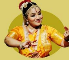
Shekh Medini Hombal